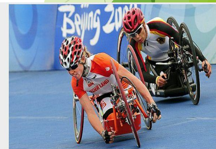
Holandanka Monique Van der Vorstová na paralympiáde v Pekingu v roku 2008.