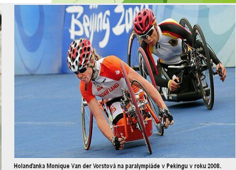
Holandanka Monique Van der Vorstová na paralympiáde v Pekingu v roku 2008.