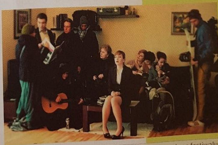
▣ Kadr z klipu do wiersza List do ludożerców - II nagroda na festiwalu Port Wrocław 2011 (scen. i reż. P. Spigiel, J. Timingeriu, muz. K. Cicha).